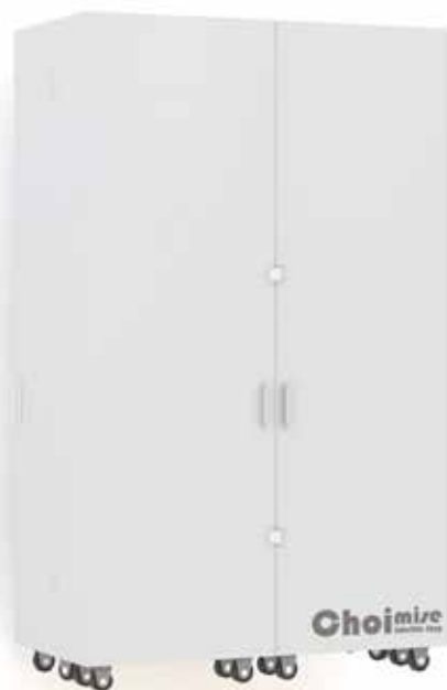
収納時 W:1330 D:703 H:2190