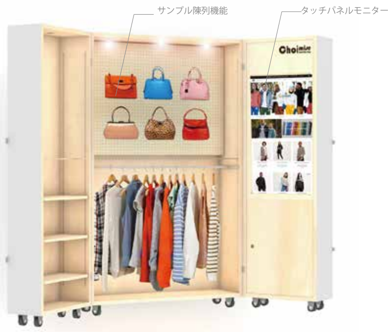
展開面積 W:1995 ~ 2660 D:350 ~ 1050 H:2190(≒0.8 坪)