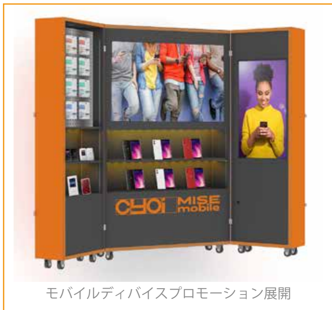
モバイルデバイスプロモーション展開

休遊スペース活性化・テナントテスト展開・サテライト展開・テナント集合VP・テストマーケティング 新商品プロモーション・期間限定催事・ブランディング什器 商業施設の様々な空間に EC 融合の売場提案