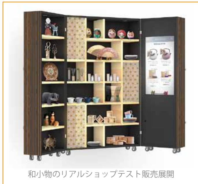
和小物のリアルショップテスト販売展開