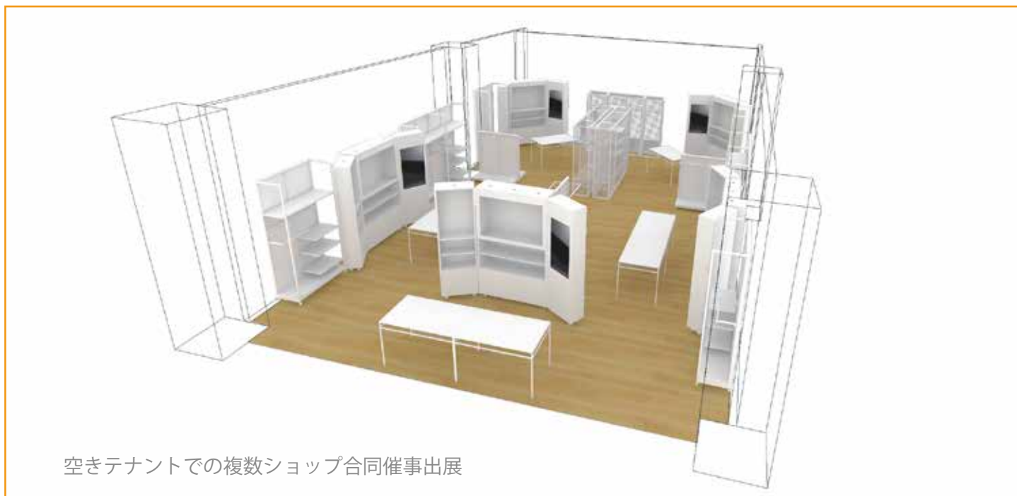
空きテナントでの複数ショップ合同催事出展